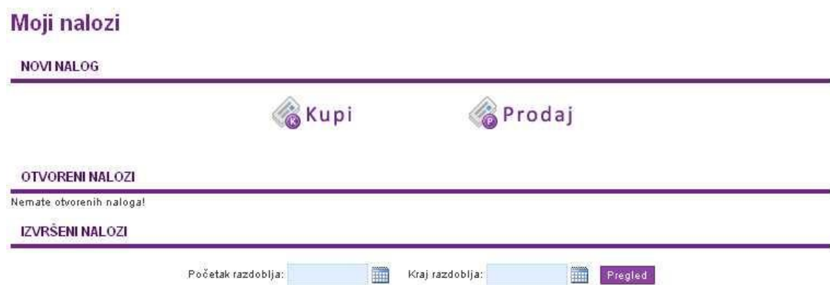
Slika 11. – Moji nalozi

Stranica s naslovom Moji nalozi (Slika 11.) sadrži ikone za otvaranje novih naloga, listu otvorenih, te upit za izlist izvršenih naloga na kupnju/prodaju dionica Natjecatelja.